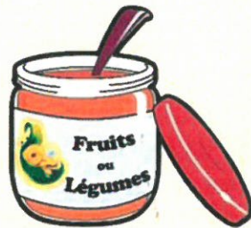
Aliments Bébé (pots verre)